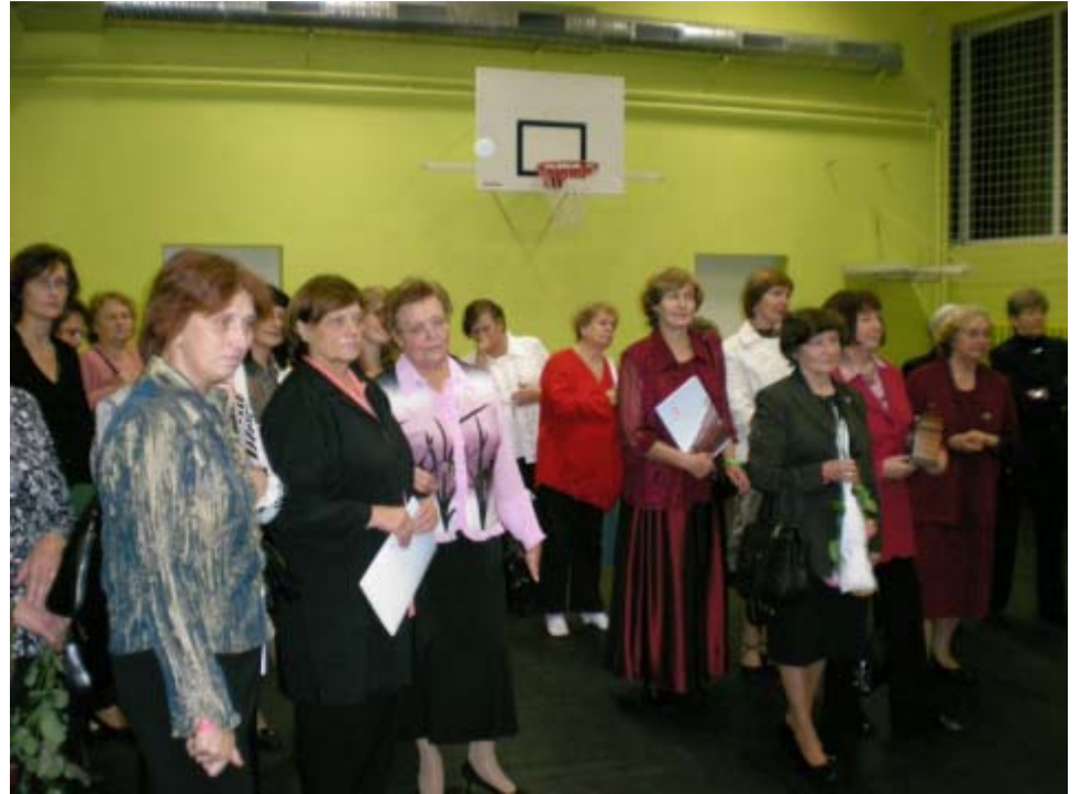
Pidulikult banketil olid kõrvuti koos praegused ja endised õpetajad ning koolipersonal ja kutsutud külalised.