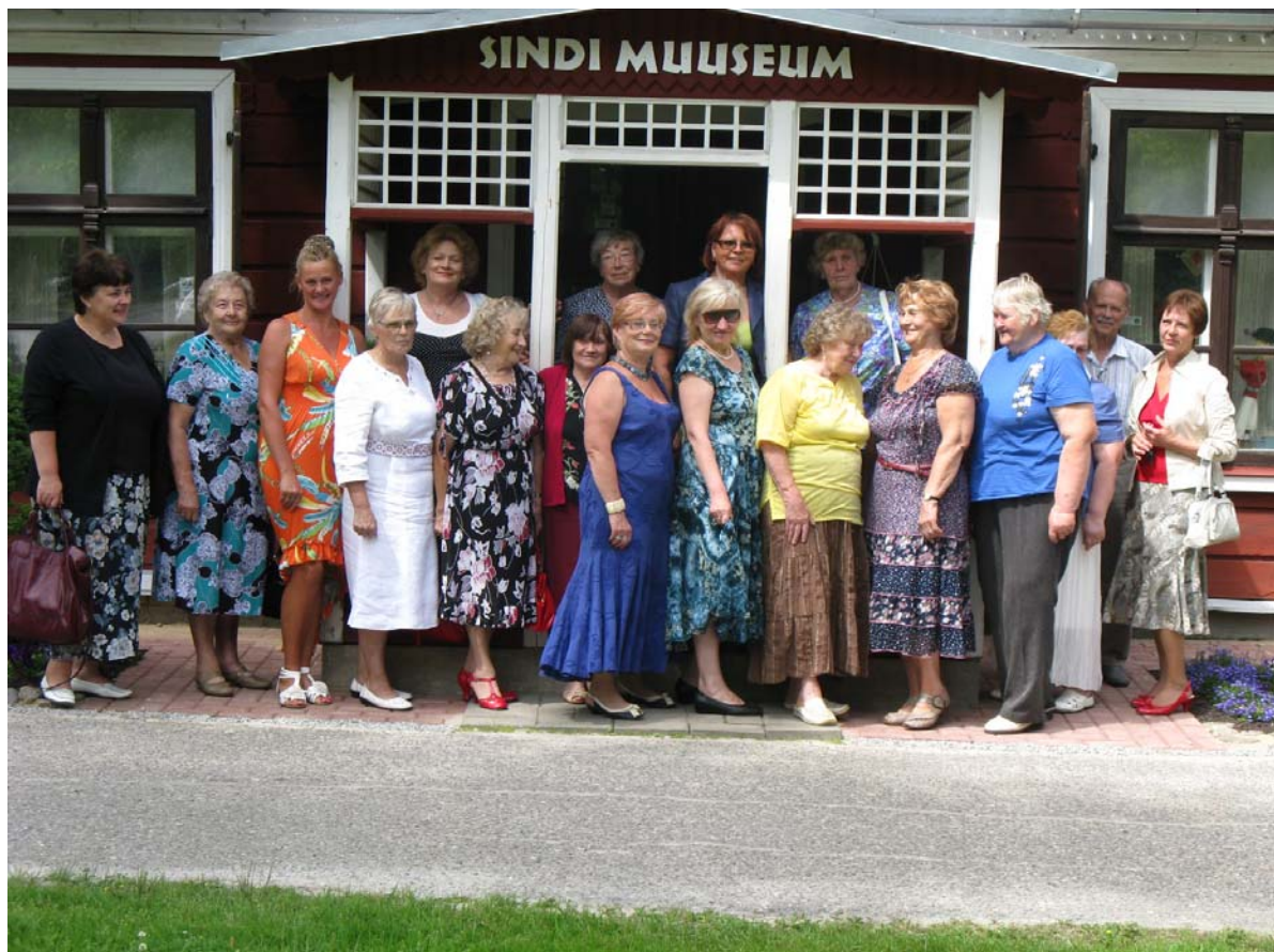
Sindi Naisliit koos külalistega Sindi Muuseumis

Vabatahtlikel naisorganisatsioonidel on Eestis ammused traditsioonid, nende tegevimestest on olnud kasu mitte ainult naistele endile vaid kogu ühiskonnale.