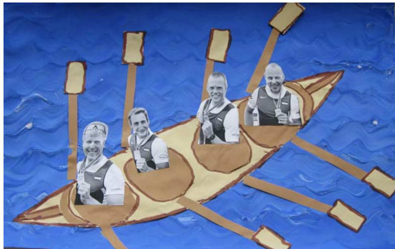
„Päikesejänku“ rühma kingitus 4-paadi meestele

Veebruarikuu viimasel nädalal on Sindi Lasteaias aastaid olnud traditsiooniks koolieelikute poistega pidada poistenädalat. Nädala raames toimub ühine spordipäev ja kohtumine mehiste meestega. Eelnevatel aastatel oleme käinud Politsei- ja piirivalvekolledži Paikuse koolis, tutvunud politsei ja päästeteenistuse tööga.